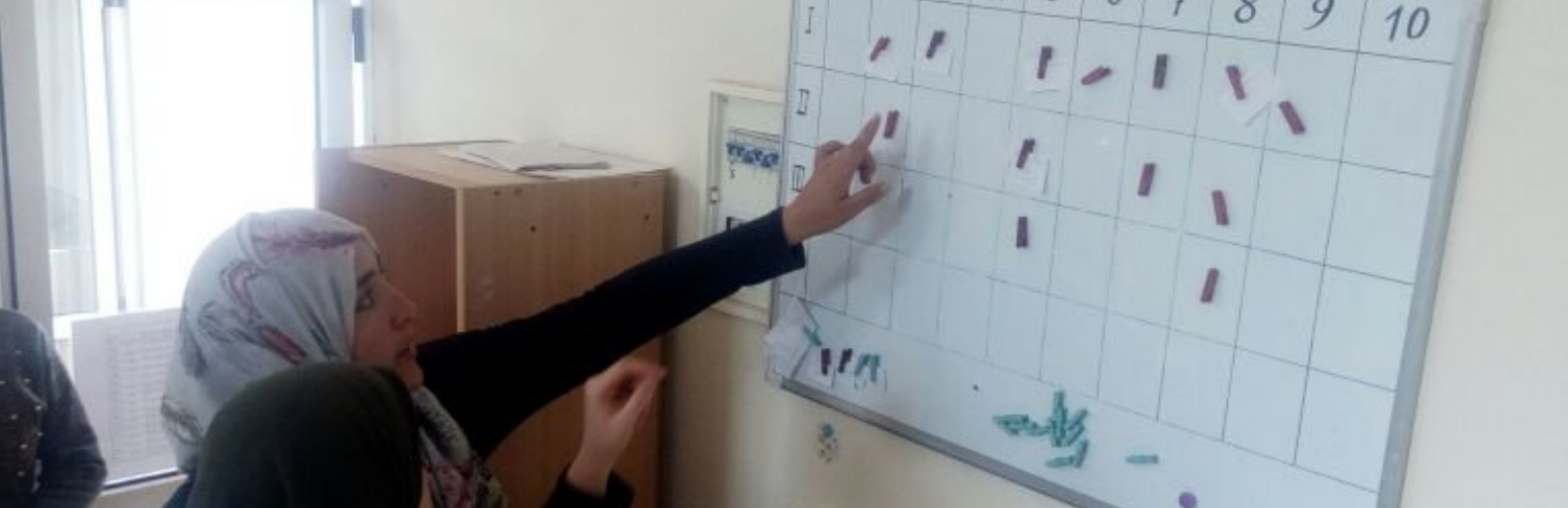
Tableau d'organisation des opérations