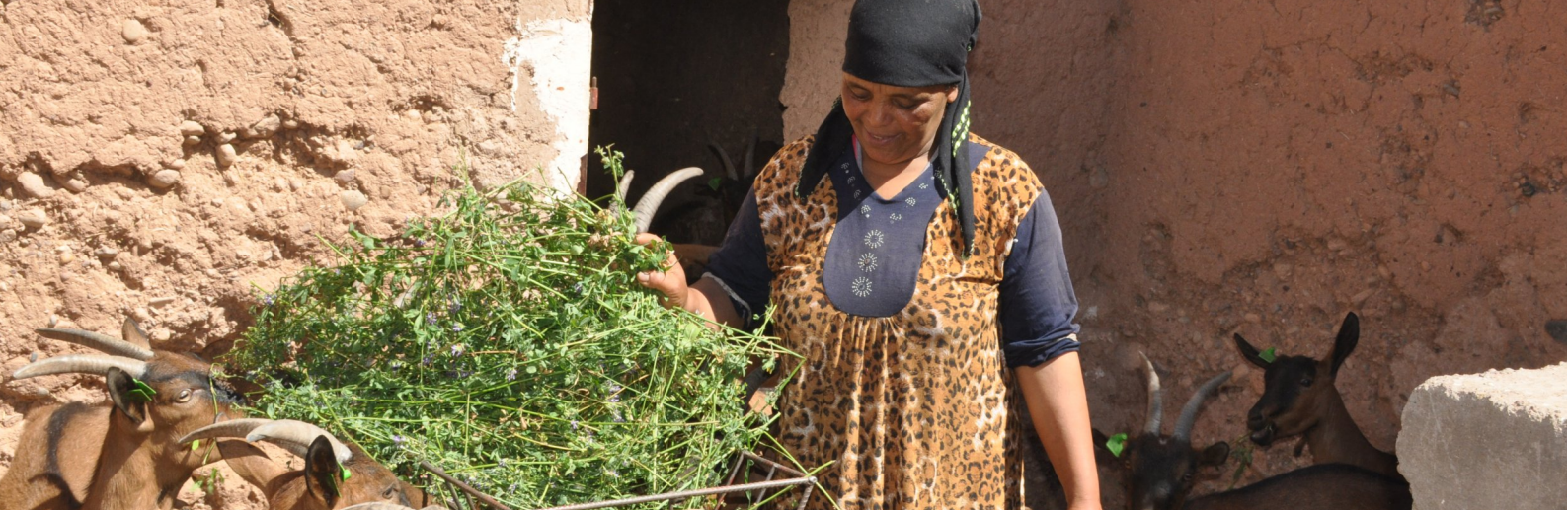
Eleveuse de la coopérative