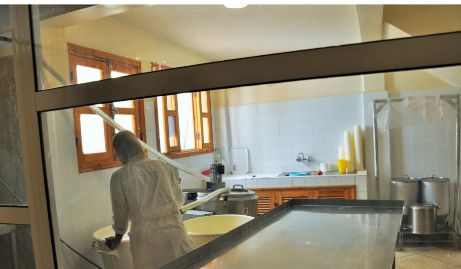
Atelier de production